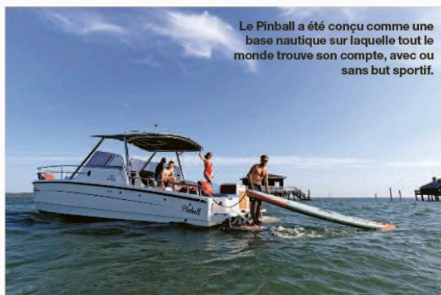
Le Pinball a été conçu comme une base nautique sur laquelle tout le monde trouve son compte, avec ou sans but sportif.