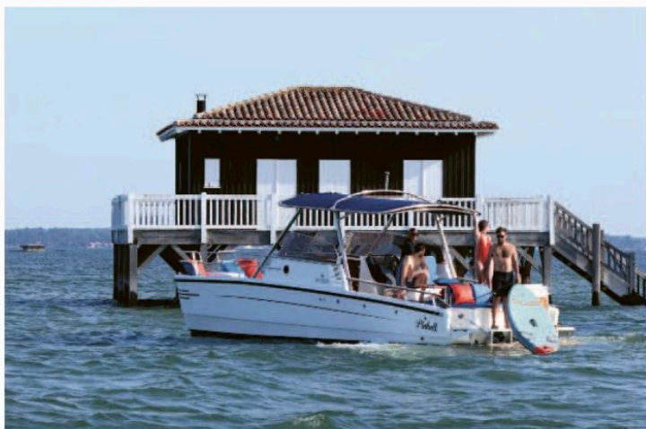
Sur le bassin d'Arcachon. Après avoir appuyé sur le bouton jaune et vidé les tuyères, le catamaran file à près de 25 nœuds.