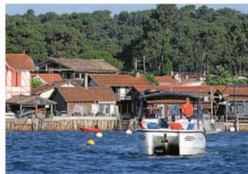
Avec ses turbines électriques, le catamaran tricolore se veut discret en termes de nuisances sonores.